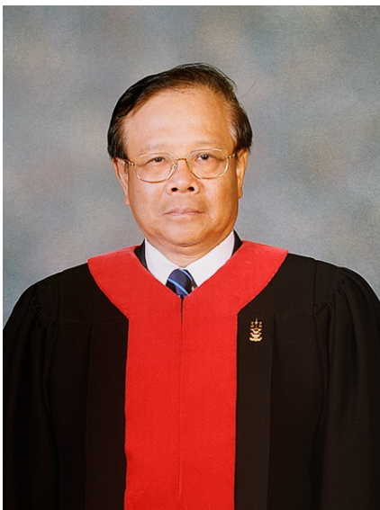
นายเฉลิมพล เอกอุรุ ตุลาการศาลรัฐธรรมนูญ (๒๘ พฤษภาคม ๒๕๕๑ ถึง ๑๙ สิงหาคม ๒๕๕๘)