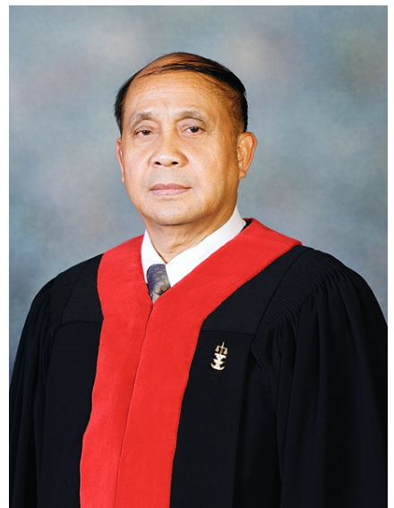
นายจรูญ อินทจาร ประธานศาลรัฐธรรมนูญ (๒๑ ตุลาคม ๒๕๕๖ ถึง ๒๐ พฤษภาคม ๒๕๕๗) ตุลาการศาลรัฐธรรมนูญ (๒๘ พฤษภาคม ๒๕๕๑ ถึง ๒๘ พฤษภาคม ๒๕๕๗)