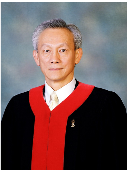
นายจรัญ ภัคดีชานกุล ตุลาการศาลรัฐธรรมนูญ (๒๘ พฤษภาคม ๒๕๕๑ ถึง ๓๑ มีนาคม ๒๕๖๓)