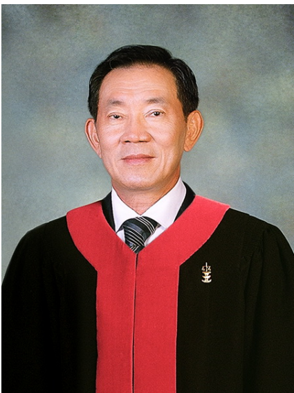
นายชัย ชลวร ประธานศาลรัฐธรรมนูญ (๒๘ พฤษภาคม ๒๕๕๑ ถึง ๑๐ สิงหาคม ๒๕๕๔) ตุลาการศาลรัฐธรรมนูญ (๑๐ สิงหาคม ๒๕๕๔ ถึง ๓๑ มีนาคม ๒๕๖๓)