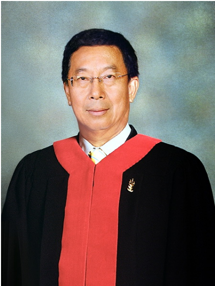
นายนุรักษ์ มาประณีต ประธานศาลรัฐธรรมนูญ (๙ กันยายน ๒๕๕๗ ถึง ๓๑ มีนาคม ๒๕๖๓) ตุลาการศาลรัฐธรรมนูญ (๒๘ พฤษภาคม ๒๕๕๑ ถึง ๙ กันยายน ๒๕๕๗)