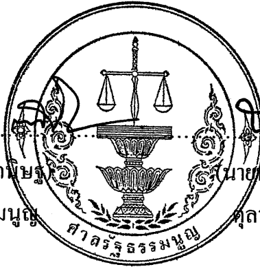
(นายนครินทร์ เมฆไตรรัตน์) ตุลาการศาลรัฐธรรมนูญ