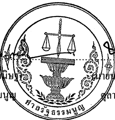
(นายชินทร์ เมฆไตรรัตน์) ตุลาการศาลรัฐธรรมนูญ