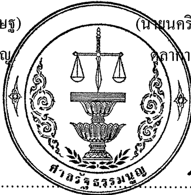
(นายบุญส่ง กุลนุปผา) ตุลาการศาลรัฐธรรมนูญ