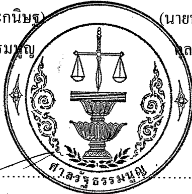
(นายบุญส่ง กุลบุปผา) ตุลาการศาลรัฐธรรมนูญ