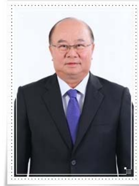
พลเอก บุญยวัฒน์ เครือหงส์ (Gen.Boonyavat Kruahongs)

อำนาจหน้าที่ของคณะกรรมการป้องกันและปราบปรามการทุจริตแห่งชาติ (คณะกรรมการ ป.ป.ช.)