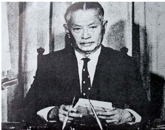
นายสัญญา ธรรมศักดิ์ นายกรัฐมนตรี

กล่าวปราศรัยทางโทรทัศน์ ณ ตึกหอพระสมุท สวนจิตรลดา เมื่อวันที่ ๑๔ ตุลาคม ๒๕๑๖