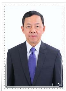
พลตำรวจเอก วัชรพล ประสารราชกิจ (Pol.Gen.Watcharapol Prasarnrajkit)