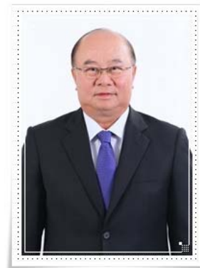
พลเอก บุญยวัจน์ เครือหงส์ (Gen.Boonyavat Kruahongs)