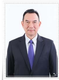
พลตำรวจเอก สถาพร หลาวทอง (Pol.Gen.Sataphon Laothong)