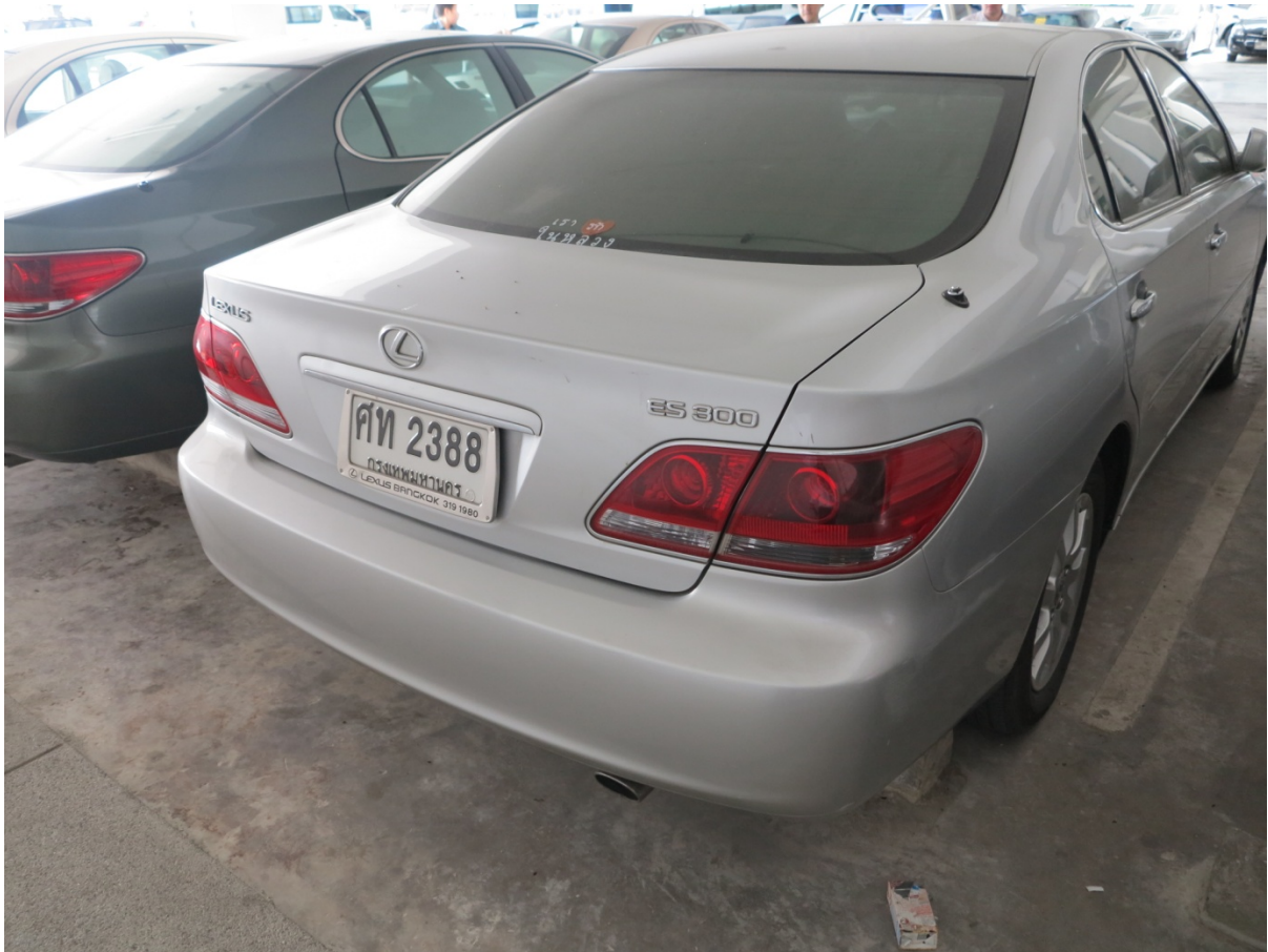
LEXUS สีเทา หมายเลขทะเบียน ศท 2388 เลขไมล์ 105546