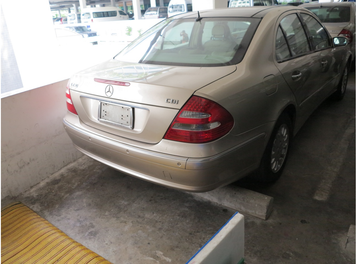
Benz สีน้ำตาล หมายเลขทะเบียน ขฉม 5838 เลขไมล์ 142906