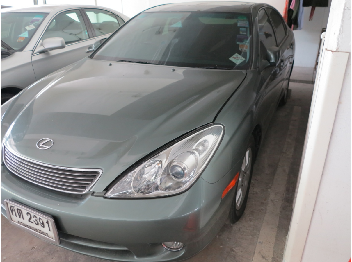
LEXUS สีเขียว หมายเลขทะเบียน ศต 2391 เลขไมล์ 139319