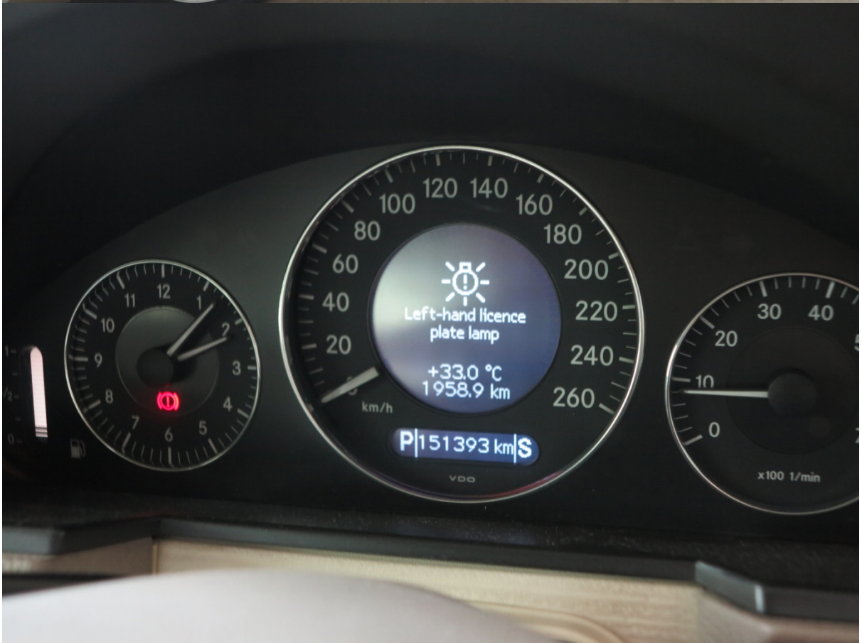
Benz สีน้ำตาล หมายเลขทะเบียน ศต 2399 เลขไมล์ 151396