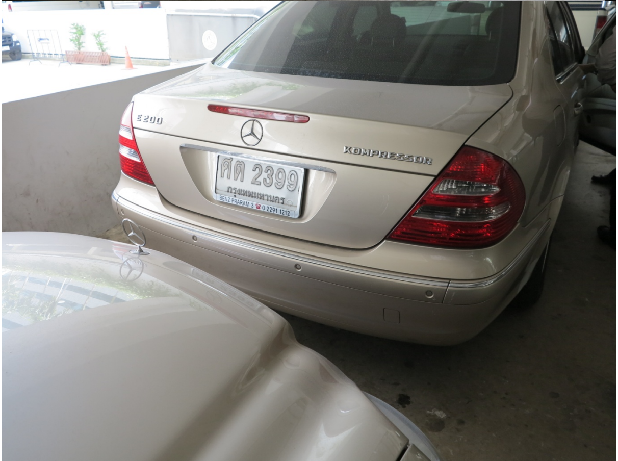
Benz สีน้ำตาล หมายเลขทะเบียน ศต 2399 เลขไมล์ 151396