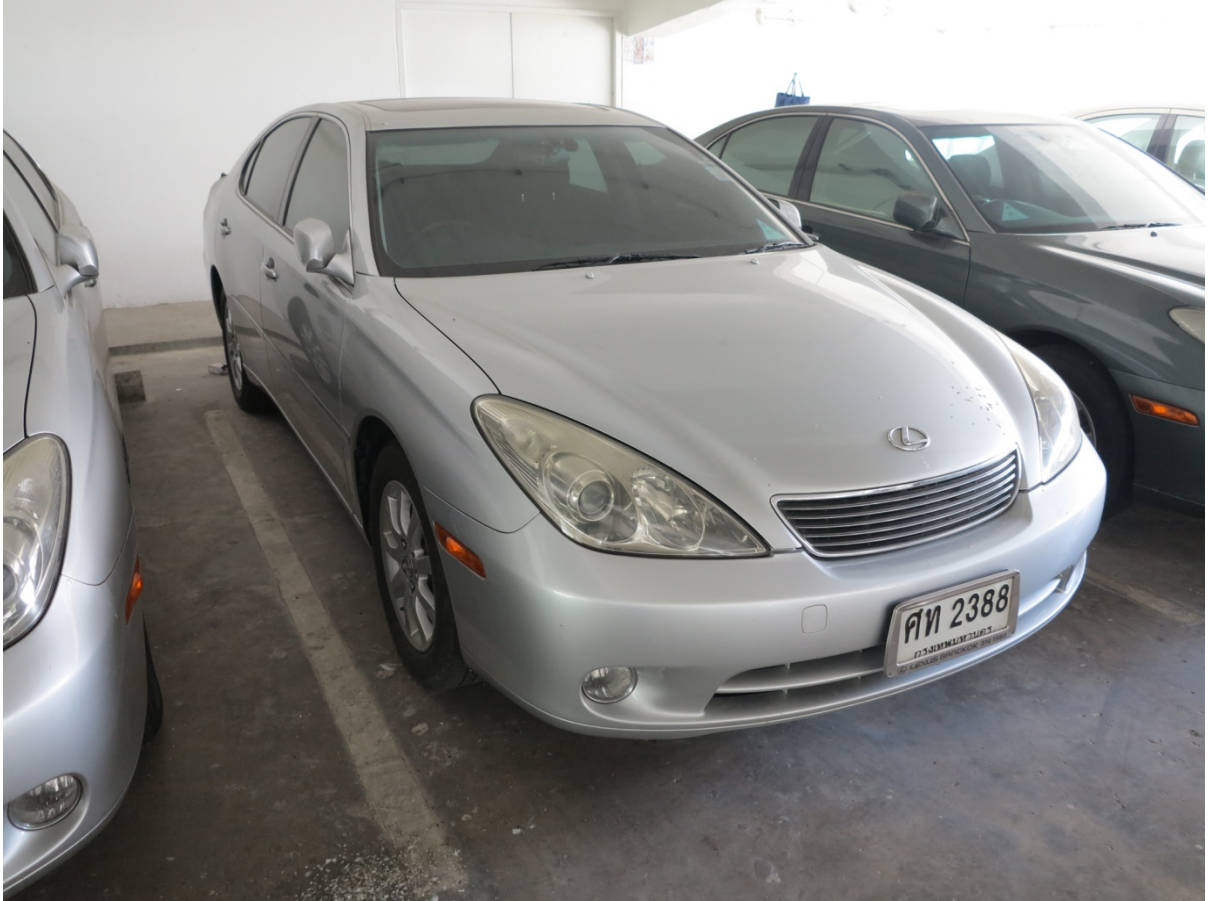
LEXUS สีเทา หมายเลขทะเบียน ศท 2388 เลขไมล์ 105546