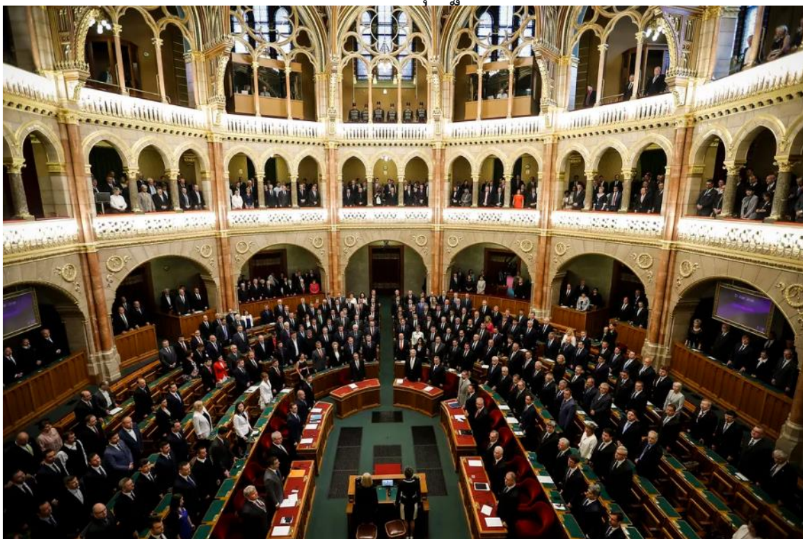
ภาพที่ 6 : ห้องประชุมรัฐสภาฮังการี

ที่มา : https://www.vox.com/policy-and-politics/2018/9/13/17823488/hungary-democracy-authoritarianism-trump [สืบค้นเมื่อ 29 กรกฎาคม 2565]