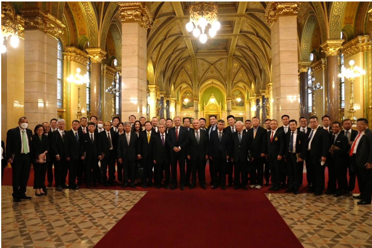
ภาพที่ 8 – 10 : การศึกษาดูงานของนักศึกษาหลักสูตรนิติธรรมเพื่อประชาธิปไตย รุ่นที่ 10