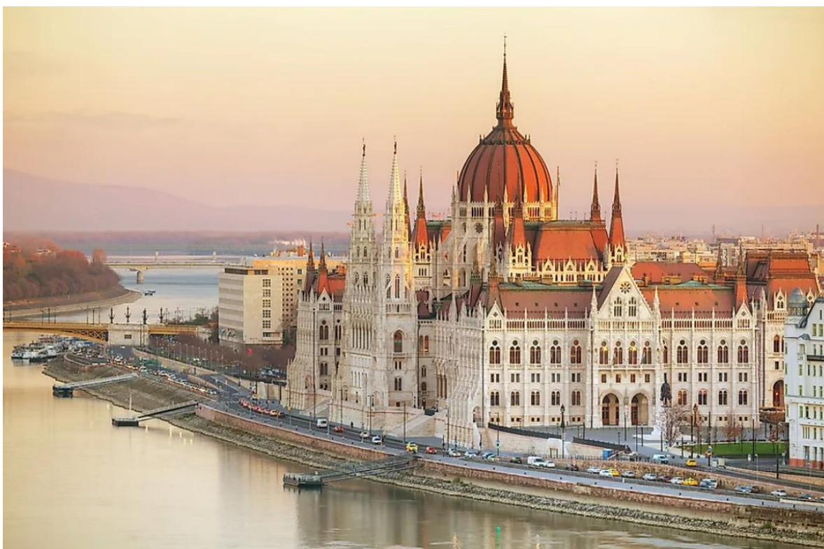
ภาพที่ 5 : อาคารรัฐสภาฮังการีริมฝั่งแม่น้ำดานูบ