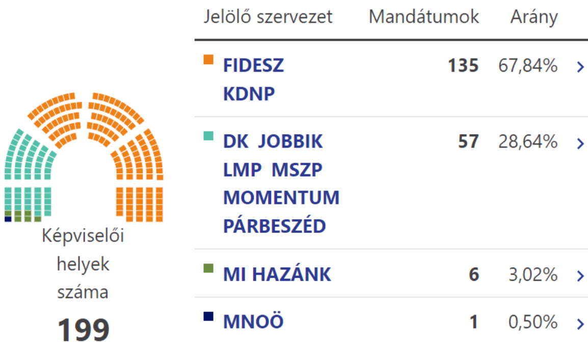
แผนภาพที่ 1 : แสดงสัดส่วนพรรคการเมืองที่ได้รับการเลือกตั้งสมาชิกรัฐสภาเมื่อวันที่ 3 เมษายน 2022

ที่มา : https://vtr.valasztas.hu/ogy2022 [สืบค้นเมื่อ 28 กรกฎาคม 2565].