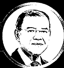
Dr. Supachai Panitchpakdi Former Secretary-General of UNCTAD and Former Director-General of the World Trade Organization (WTO)