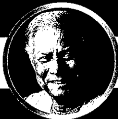
Prof. Muhammad Yunus (To be confirmed)