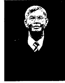
นายประจัน คล้ายสุบรรณ อธิบดีศาลปกครองเพชรบุรี