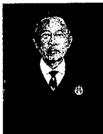
นายเกียรติภูมิ แสงศศิธร อธิบดีศาลปกครองนครราชสีมา