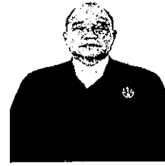
นายอาทร คุระวรรณ อธิบดีศาลปกครองสงขลา