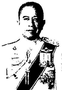
๗. พลตำรวจเอก ทวีชาติ พละศักดิ์ อดีตที่ปรึกษาพิเศษสำนักงานตำรวจแห่งชาติ