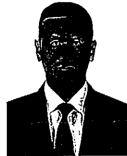
๑๔. พลเอก สุรใจ จิตต์แจ่ม อดีตหัวหน้าสำนักงานกิจการกระจายเสียง กิจการโทรทัศน์ และกิจการโทรคมนาคม กองทัพบก