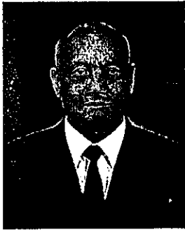
๑๑. พลเอก มโน นุชเกษม ผู้ทรงคุณวุฒิพิเศษ สำนักงานปลัดกระทรวงกลาโหม