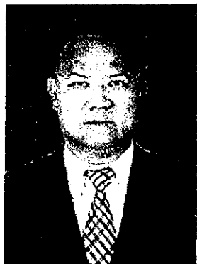
๕. พันตำรวจเอก มนัส นครศรี อดีตรองผู้บังคับการ กองบังคับการอำนวยการ กองบัญชาการตำรวจภูธรภาค ๑