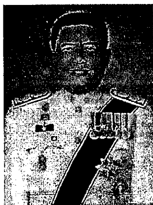
๓. นายมณฑิธร เจริญผล รองผู้ว่าการตรวจเงินแผ่นดิน