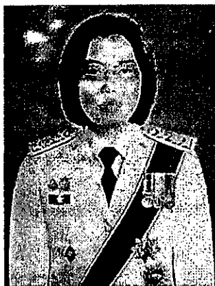
๕. นางสาวอัญชลี เจริญทรัพย์ อดีตรองผู้ว่าการตรวจเงินแผ่นดิน