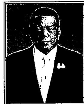
พลโท มณฑล ปราการสมุทร (ด้านการคุ้มครองผู้บริโภค)