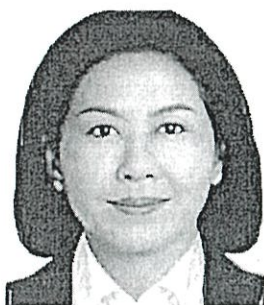
๑๓. นางธนาภรณ์ พรหมสุวรรณ อดีตอธิบดีกรมส่งเสริม และพัฒนาคุณภาพชีวิตคนพิการ