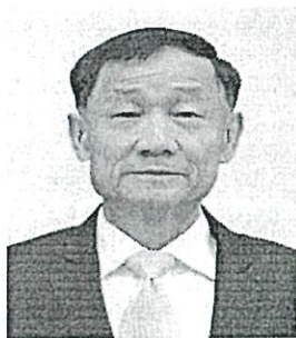
๓. พลเรือเอก ประสาน สุขเกษตร อดีตรองผู้บัญชาการทหารสูงสุด