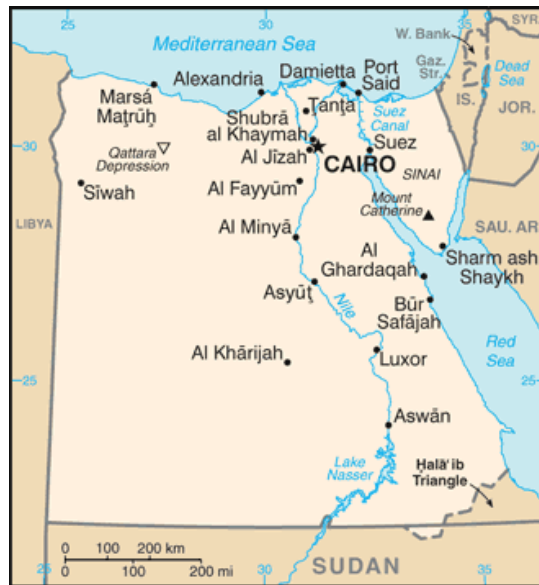
ภาพที่ ๑ แผนที่ประเทศอียิปต์