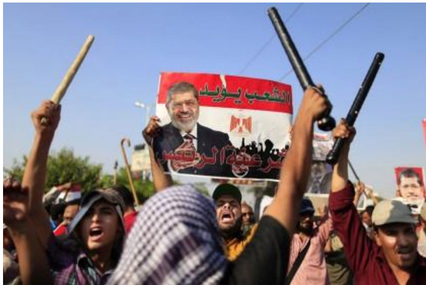
ภาพที่ ๒ ภาพกลุ่มผู้สนับสนุนประธานาธิบดี โมฮัมเหม็ด มอร์ซี

ปะทะกันระหว่างฝ่ายเจ้าหน้าที่ของรัฐและของฝ่ายประชาชนผู้สนับสนุนคนละข้างการเมือง และมีการลอบสังหารผู้นำการต่อต้านรัฐบาล การปะทะกันมีหนักขึ้นเรื่อย ๆ สถานการณ์ลุกลามบานปลาย เป็นความแตกแยกอย่างรุนแรง เมื่อมอร์ซีไม่ยอมรับเส้นตายดังกล่าว อัซซีซีจึงตัดสินใจประกาศยึดอำนาจจากมอร์ซี เมื่อวันที่ ๓ กรกฎาคมหลังครบกำหนดเส้นตาย และชี้แจงต่อสาธารณชนถึงเหตุที่จำเป็นต้องตัดสินใจยึดอำนาจว่าเป็นเพราะประธานาธิบดีมอร์ซีไม่ยอมฟังเสียงประชาชน และหากปล่อยให้มอร์ซีอยู่ในตำแหน่งต่อไป ก็อาจนำไปสู่การเผชิญหน้าอย่างรุนแรงระหว่างกลุ่มผู้สนับสนุนมอร์ซีกับ NSF ได้ (อนู ยะมีนะฮ์, ๒๕๕๖) และมีการระงับการใช้รัฐธรรมนูญ พร้อมทั้งแต่งตั้งนายอดีลี อัล-มานซูร์ ผู้พิพากษาหัวหน้าศาลรัฐธรรมนูญสูงสุด เป็นประธานาธิบดีรักษาการ จนกว่าจะมีการเลือกตั้งประธานาธิบดีใหม่ แม้ชาวอียิปต์บางส่วนจะยินดีที่มอร์ซี ถูกโค่นล้ม แต่การเข้ามายึดอำนาจของกองทัพก็สร้างความวิตกให้ชาวอียิปต์จำนวนมาก และนานาชาติที่เชิดชูระบอบ “ประชาธิปไตย” รวมทั้งสหรัฐอเมริกา ซึ่งเป็นผู้สนับสนุนหลักด้านการเงินให้กองทัพอียิปต์มาตลอด เพราะยังคงเกิดเหตุการณ์ปะทะนองเลือดกันอย่างควบคุมไม่ได้ ระหว่างฝ่ายผู้สนับสนุนอดีตประธานาธิบดีมอร์ซี และฝ่ายทหารของรัฐบาลใหม่ หรือประชาชนที่สนับสนุนฝ่ายรัฐบาลใหม่ ความวุ่นวายยังคงดำรงกันต่อไป ประชาคมโลกยังได้เรียกร้องให้กองทัพอียิปต์คืนอำนาจให้แก่พลเรือน โดยเร็วที่สุด เพื่อให้สถานการณ์กลับสู่ภาวะปกติโดยเร็ว