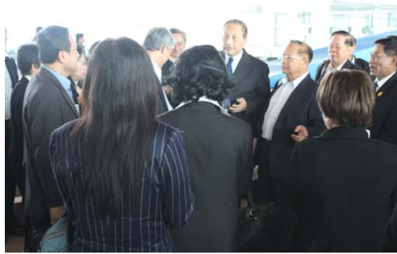
ท่านเอกอัครราชทูต นายกฤต ไกรจิตติ ต้อนรับที่สนามบิน

ที่สนามบิน เอกอัครราชทูต ณ กรุงกัวลาลัมเปอร์ นายกฤต ไกรจิตติและอุปทูตนายทรงศักดิ์ สายเชื้อ พร้อมเจ้าหน้าที่รอด้อนรับคณะที่ประตูทางออกจากเครื่องและพาคณะไปที่ห้องรับรองที่อาคารหลักของสนามบิน อำนวยความสะดวกด้านพิธีการเข้าเมือง