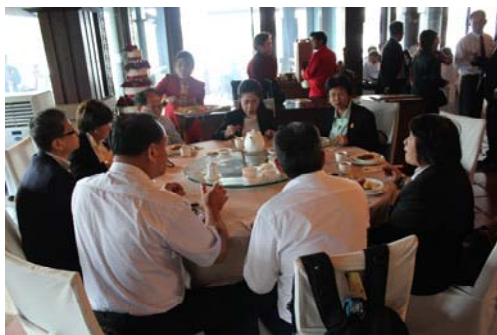
อาหารกลางวันทีอร่อยแต่ต้องรีบ

เวลาประมาณ 13.40 น. เดินทางถึงร้านอาหาร Putrajaya Seafood Restaurant ที่ตั้งอยู่ริมทะเลสาบ ในเมือง Putrajaya บรรยากาศสวยงาม อาหารมื้อนี้เป็นอาหารทะเลแบบผสม รสชาติดูจืดจางแต่เนื่องจากจะต้องเดินทางไปศาลสูงสุดมาเลเซีย ตามเวลาที่นัดไว้ 14.30 น. ต้องรีบรับประทานอาหาร จึงมีเสียงบ่นเบาๆออกมาว่า เมื่อเช้าก็ต้องรีบกินตั้งแต่ตี 5 อิ่มบ้างไม่อิ่มบ้าง พอมาเจอมื้ออร่อยก็ต้องกินแบบรีบๆ ถึงช่วงเสิร์ฟอาหารหวาน บางท่านดื่มน้ำได้คำเดียว บางท่านได้แต่มอง ก็ต้องรีบขึ้นรถ เพื่อไปที่ศาลสูงมาเลเซียให้ทันตามเวลาที่นัดไว้