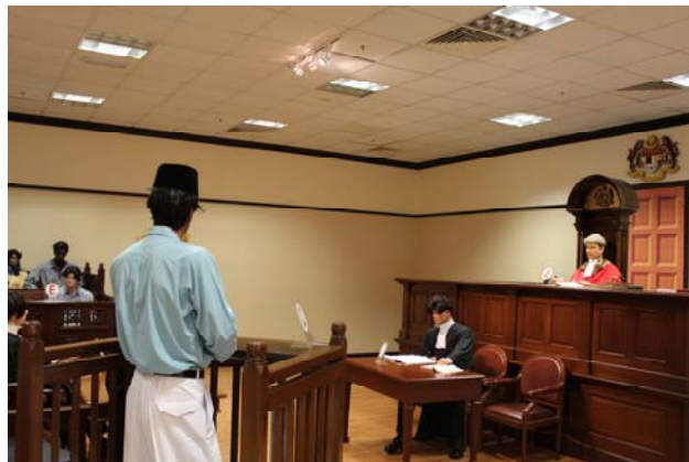
ห้องและหุ่นจำลองการพิจารณาคดีโดยระบบลูกขุน

ต่อมาเจ้าหน้าที่ได้นำชมพิพิธภัณฑ์ของศาลที่ได้นำเครื่องใช้ และอุปกรณ์ที่เกี่ยวกับการพิจารณาคดีในอดีต เช่น เสื้อครุยของผู้พิพากษา ตราประทับที่ใช้ เอกสารคำฟ้องและคำให้การมาแสดงไว้ โดยมีการทำหุ่นจำลองห้องพิจารณาคดีในอดีตที่ใช้ระบบลูกขุนตั้งแสดงไว้ด้วย ต่อมาได้เข้าฟังการพิจารณาคดีของศาลอุทธรณ์ที่กำลังมีการแถลงคดีของกลุ่มความในขณะนั้นด้วย