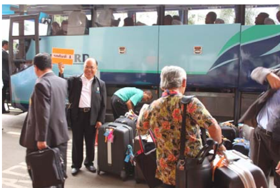
ที่สนามบินกรุงจาการ์ตา

ออกเดินทางไปกรุงจาการ์ตา วันที่ 4 มีนาคม 2556 ออกเดินทางจากสนามบินสุวรรณภูมิ เวลา 8.20 น. โดยสายการบินการบินไทยเที่ยวบินที่ TG433 ถึงสนามบินชูการ์โนฮัตตะ กรุงจาการ์ตา เวลา 11.30 น. (เวลาที่กรุงจาการ์ตาตรงกับเวลาในประเทศไทย) แล้วเดินทางไปที่พักโรงแรม Pullman Jakarta Central Park Podomoro City Jl. Let. Jend S Parman Kav 28 Jakarta Barat 11470 JAKARTA โดยรถบัสที่ผู้จัดการเดินทางจัดไว้ จำนวน สองคัน เนื่องจากมีการจัดกลุ่มผู้เข้ารับการอบรมไว้แล้วเป็น 4 กลุ่ม ได้กำหนดให้กลุ่มที่ 1-2 ขึ้นรถคันที่ 1 กลุ่มที่ 3-4 ขึ้นรถคันที่ 2 จึงเกิดความสะดวกรวดเร็วไม่เกิดปัญหาขุลมุนว่าใครจะขึ้นรถคันไหน