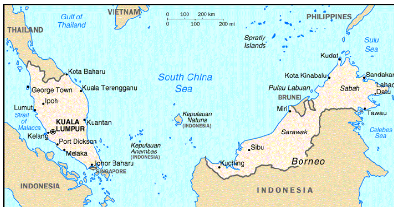
แผนที่ประเทศมาเลเซีย

ระบบการปกครองประเทศของมาเลเซียเป็นแบบสหพันธรัฐ มีพระมหากษัตริย์เป็นประมุข มีรัฐบาลกลาง (Federal Government) เป็นผู้บริหารประเทศ มีกรุงกัวลาลัมเปอร์เป็นเมืองหลวง