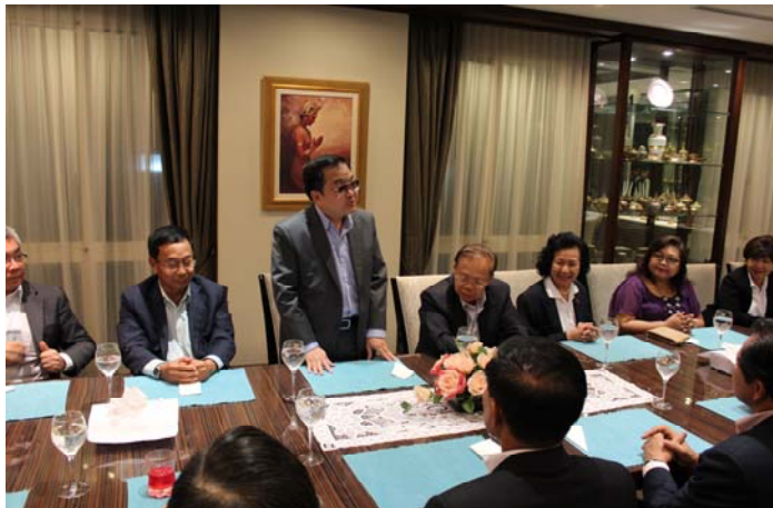
ท่านทูตกล่าวต้อนรับ

งานเลี้ยงรับรองที่สถานเอกอัครราชทูตไทย ณ กรุงจาการ์ตา เวลา 19.00 น. ของวันที่ 4 มีนาคม 2556 สถานเอกอัครราชทูตไทย ณ กรุงจาการ์ตา เป็นเจ้าภาพจัดเลี้ยงอาหารค่ำแก่คณะที่ทำเนียบเอกอัครราชทูตซึ่งอยู่บริเวณเดียวกันกับสถานเอกอัครราชทูต