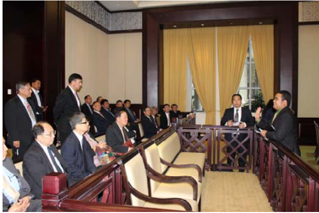
พวชมห้องพิจารณาคดีของศาลอุทธรณ์และอธิบายถึงระบบศาล

ต่อมาเจ้าหน้าที่ได้นำชมพิพิธภัณฑ์ของศาลที่ได้นำเครื่องใช้ และอุปกรณ์ที่เกี่ยวกับการพิจารณาคดีในอดีต เช่น เสื้อครุยของผู้พิพากษา ตราประทับที่ใช้ เอกสารคำฟ้องและคำให้การมาแสดงไว้ โดยมีการทำหุ่นจำลองห้องพิจารณาคดีในอดีตที่ใช้ระบบลูกขุนตั้งแสดงไว้ด้วย ต่อมาได้เข้าฟังการพิจารณาคดีของศาลอุทธรณ์ที่กำลังมีการแถลงคดีของกลุ่มความในขณะนั้นด้วย