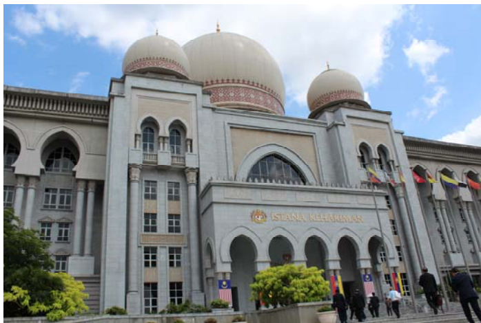
อาคาร Palace of Justice ที่ตั้งของศาลสูงสุด

คณะเดินทางไปถึงศาลสูงสุดมาเลเซียช้ากว่าเวลาที่นัดไว้ประมาณ 10 นาที ที่ศาลสูงสุดมาเลเซียมีเจ้าหน้าที่มาเลเซียรอต้อนรับอยู่ที่หน้าศาล ในการต้อนรับผู้มาเยือนเป็นประเพณีของศาลสูงสุด ที่ประธานสูงสุดจะต้อนรับผู้มาเยือนที่มีความสำคัญในหน่วยงาน แต่เนื่องจากหน่วยงานรองรับคณะศึกษาดูงานไม่ได้ทั้งหมด จึงได้ตกลงกันให้ตุลาการศาลรัฐธรรมนูญ ท่านเอกอัครราชทูต หัวหน้าผู้เข้ารับการอบรม และตัวแทนผู้เข้ารับการอบรมอีกสี่ท่านเข้าเยี่ยมชมการะประธานศาลสูงสุดมาเลเซียที่หน่วยงาน