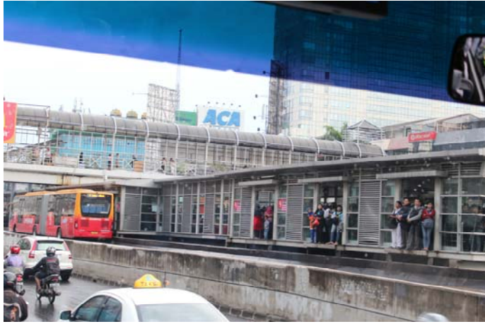
ประชาชนรอขึ้นรถเมล์ช่องทางพิเศษ

งานเลี้ยงรับรองที่สถานเอกอัครราชทูตไทย ณ กรุงจาการ์ตา เวลา 19.00 น. ของวันที่ 4 มีนาคม 2556 สถานเอกอัครราชทูตไทย ณ กรุงจาการ์ตา เป็นเจ้าภาพจัดเลี้ยงอาหารค่ำแก่คณะที่ทำเนียบเอกอัครราชทูตซึ่งอยู่บริเวณเดียวกันกับสถานเอกอัครราชทูต