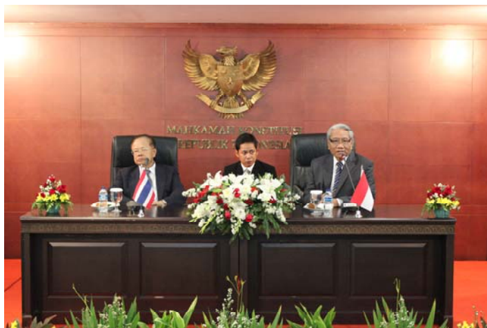
ที่ศาลรัฐธรรมนูญอินโดนีเซีย

วันที่ 5 มีนาคม 2556 ช่วงเช้าก่อนถึงเวลาศึกษาคุณงานที่ศาลรัฐธรรมนูญอินโดนีเซีย ในเวลา 14.00 น. ไปศึกษาชมพิพิธภัณฑ์แห่งชาติ ของอินโดนีเซีย กรุงจาการ์ตา ต่อมาในเวลา 14.00 น. ไปศึกษาคุณงานที่ศาลรัฐธรรมนูญอินโดนีเซียที่ตั้งอยู่ที่ Jl. Medan Merdeka Barat 6Jakarta 10110