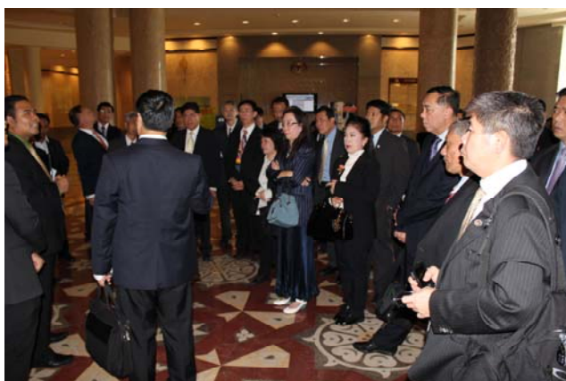
เจ้าหน้าที่ศาลมาเลเซียต้อนรับ พาชมบรีเวนศาล

คณะศึกษาดูงานอีกส่วนหนึ่ง เจ้าหน้าที่ศาลมาเลเซียได้นำชมศาลและอธิบายให้ทราบว่า ที่อาคาร Palace of Justice นั้นนอกจากเป็นที่ตั้งของศาลสูงสุดแล้วยังเป็นที่ตั้งของศาลอุทธรณ์ ที่ย้ายมาจากอาคารศาลที่กรุงกัวลาลัมเปอร์ด้วย ห้องพิจารณาคดีของศาลอุทธรณ์ มี 6 ห้อง การพิจารณาคดีของศาลอุทธรณ์ไม่มีการสืบพยานใหม่ แต่เปิดห้องพิจารณาเพื่อเปิดโอกาสให้โจทก์หรือจำเลยแถลงคดีต่อศาล ซึ่งศาลก็สามารถซักถามประเด็นให้มีความชัดเจนขึ้น การพิจารณาคดีของศาลมาเลเซียได้วางกรอบการพิจารณาคดีไว้ด้วยคือ ศาลชั้นต้นใช้เวลาไม่เกิน 9 เดือน ตั้งแต่วันเริ่มคดีจนถึงตัดสิน ศาลอุทธรณ์และศาลสูงสุดแต่ละศาล ใช้เวลาพิจารณาคดีประมาณ 3 เดือน ต่อข้อซักถามว่าแต่ละศาลมีคดีค้างมากน้อยเพียงใด ได้รับคำชี้แจงว่า คดีที่ค้างอยู่มีประมาณ 10 เปอร์เซ็นต์ ศาลแพ่งที่กัวลาลัมเปอร์มีการแยกคดีการค้า (Commercial cases) ออกมาต่างหากจากคดีแพ่งทั่วไป โดยคดีการค้าจะมีประมาณ 40 เปอร์เซ็นต์ของคดีทั้งหมด