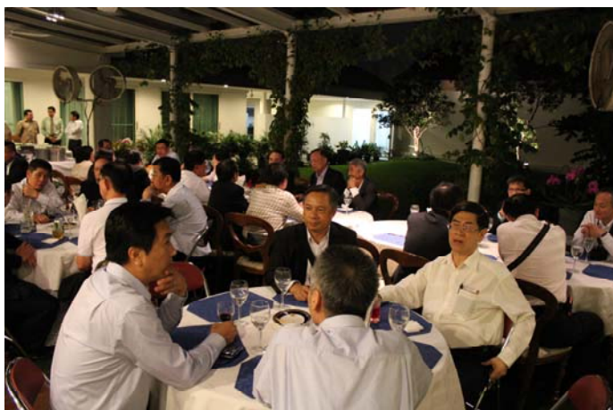
บรรยากาศอาหารค่ำที่ทำเนียบเอกอัครราชทูต