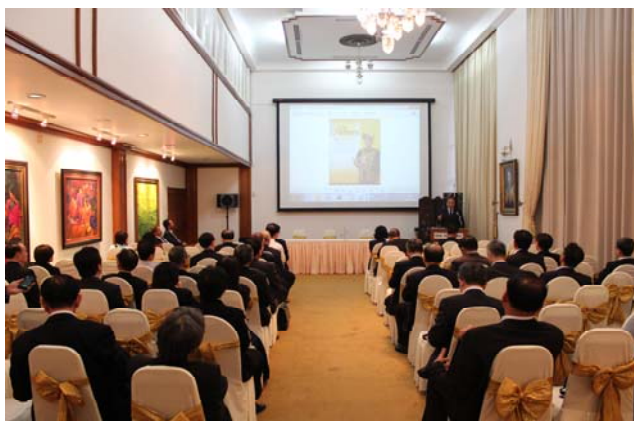
ฟังการบรรยายสรุปที่ห้องประชุมสถานทูต

หลังจากการดูงานที่ศาลสูงสุดมาเลเซียสิ้นสุดลง คณะได้เดินทางไปยังสถานเอกอัครราชทูตไทย ณ กรุงกัวลาลัมเปอร์ ที่ตั้งอยู่ที่ 206 Jalan Ampang 50450 Kuala Lumpur เพื่อร่วมรับประทานอาหารค่ำตามที่สถานเอกอัครราชทูตไทยเป็นเจ้าภาพ เมื่อไปถึงสถานเอกอัครราชทูต เอกอัครราชทูตได้บรรยายสรุปถึงความสัมพันธ์ระหว่าง ประเทศไทยและประเทศมาเลเซีย ต่อจากนั้นอุปทูตได้ บรรยายถึงสภาพการเมือง เศรษฐกิจ การค้าของมาเลเซีย หลังจากนั้นจึงรับประทานอาหารค่ำที่ทำเนียบเอกอัครราชทูตที่ตั้งอยู่บริเวณเดียวกันกับสถานทูต