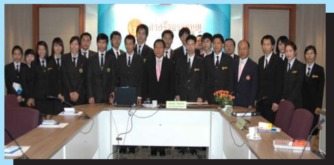
นายเขวณะ ไตรมาศ เลขาธิการสำนักงานศาลรัฐธรรมนูญ กล่าวต้อนรับและบรรยายเรื่อง “บทบาท อำนาจหน้าที่ การปฏิบัติงาน และผลการดำเนินงานของศาลรัฐธรรมนูญ” แก่นักศึกษาและอาจารย์ สาขาวิชานิติศาสตร์ คณะมนุษยศาสตร์และสังคมศาสตร์ มหาวิทยาลัยราชภัฏอุดรธานี เนื่องในโอกาสเข้าศึกษาดูงานศาลรัฐธรรมนูญ ณ ห้องประชุม ๔/๑ สำนักงานศาลรัฐธรรมนูญ อาคารศูนย์ราชการเฉลิมพระเกียรติ ๘๐ พรรษา ๕ ธันวาคม ๒๕๕๐ (อาคาร A) ถนนแจ้งวัฒนะ เมื่อวันที่ ๒ มีนาคม ๒๕๕๓