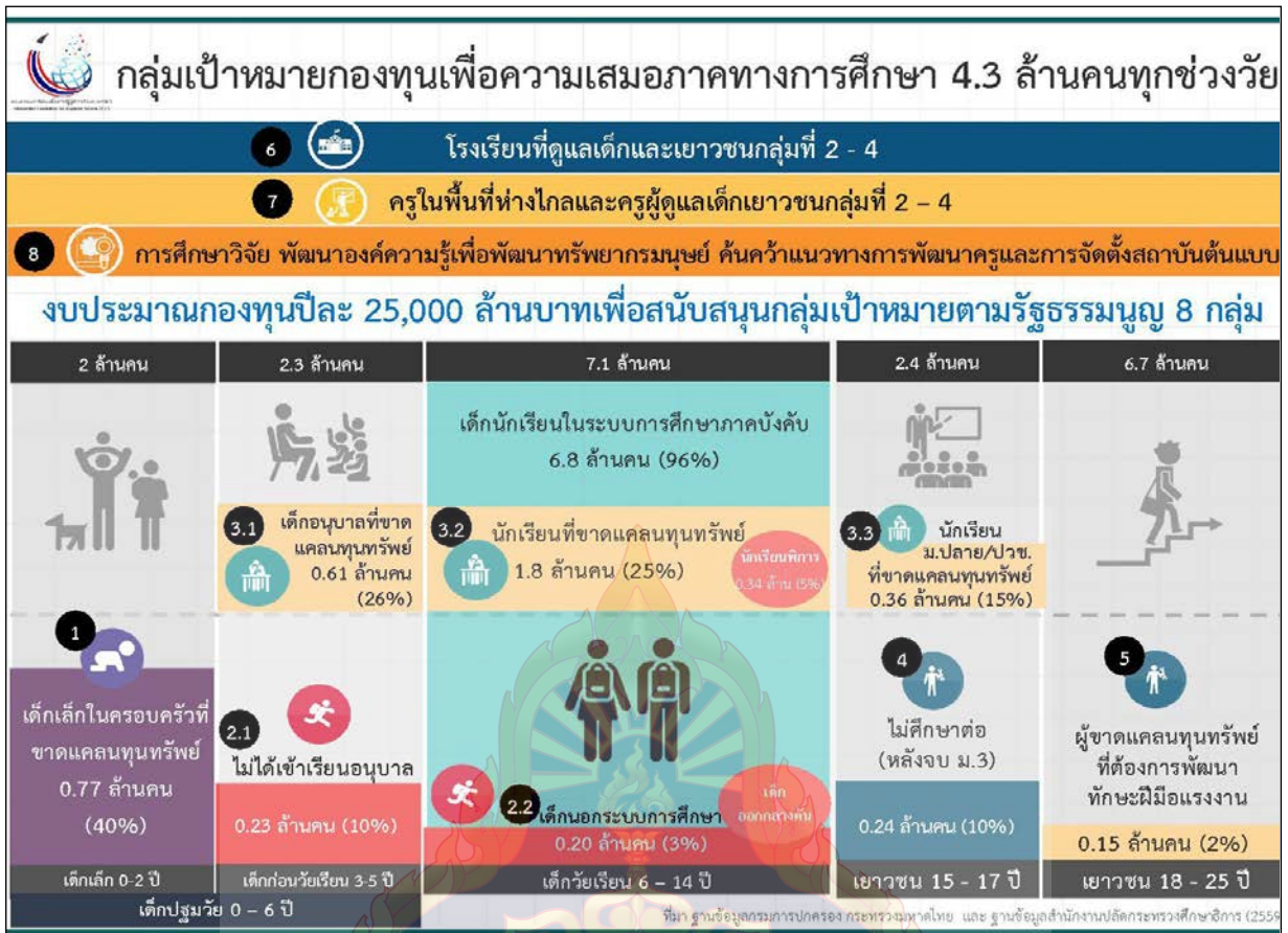
ภาพที่ ๒ : สถานการณ์ความเหลื่อมล้ำด้านโอกาสทางการศึกษาในประเทศไทย

คณะกรรมการอิสระจึงได้กำหนดกลุ่มเป้าหมายหลักของกองทุนเพื่อความเสมอภาคทางการศึกษา ออกเป็น ๙ กลุ่มเป้าหมายดังต่อไปนี้