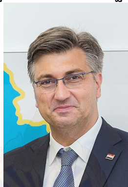
Andrej Plenković (อังเดรจ์ เพลนโควิก)

องค์กรตุลาการโครเอเชีย ศาลเป็นองค์กรที่ใช้อำนาจตุลาการ โดยรัฐธรรมนูญของโครเอเชีย รับรองให้การใช้อำนาจตุลาการมีความเป็นอิสระและไม่อยู่ใต้อำนาจของบุคคลใด วิธีพิจารณาของศาล เป็นไปโดยเปิดเผย ระบบศาลยุติธรรมโครเอเชียจะแบ่งออกเป็น 3 ชั้นศาล ประกอบด้วยศาลสูงสุด ศาลมณฑล และศาลเทศบาล ซึ่งศาลสูงสุดมีจำนวน 1 แห่ง ศาลมณฑลมีจำนวน 15 แห่ง และศาลเทศบาล 67 แห่ง นอกจากนี้โครเอเชียยังมีศาลพิเศษอื่น ๆ เช่น ศาลพาณิชย์ ศาลคดีมโนสำเนาในความผิดทางอาญาเล็กน้อย (เช่นการละเมิดกฎหมายจราจร) ศาลปกครอง และศาลรัฐธรรมนูญ