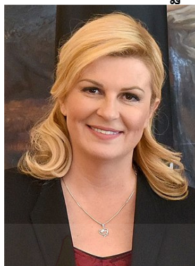
Kolinda Grabar-Kitarović (โคลินดา กราบาร์ คิตาโรวิช)

ประธานาธิบดีของโครเอเชีย ดำรงตำแหน่งเป็นประมุขของประเทศ มีที่มาจาก การเลือกตั้งโดยตรง มีวาระการดำรงตำแหน่งคราวละ 5 ปี ผู้ดำรงตำแหน่งประธานาธิบดีอยู่ในวาระได้สูงสุดไม่เกิน 2 วาระ รวมทั้งเป็นผู้บัญชาการทหารสูงสุดของกองทัพ และเป็นผู้มีอำนาจแต่งตั้งคณะรัฐมนตรี โดยความเห็นชอบของรัฐสภา การดำรงตำแหน่งประธานาธิบดีนั้นห้ามเป็นสมาชิกพรรคการเมืองใด ๆ เมื่อผู้ใดได้รับเลือกตั้งให้เป็นประธานาธิบดีแล้วจะต้องลาออกจากการเป็นสมาชิกพรรคการเมืองก่อนเข้ารับตำแหน่งประธานาธิบดี อย่างไรก็ตาม อำนาจหน้าที่ของประธานาธิบดีโครเอเชียส่วนใหญ่จะมุ่งเน้นการเป็นประมุขด้านพิธีการมากกว่าการบริหารปกครองประเทศ ส่วนบุคคลที่ทำหน้าที่เป็นฝ่ายบริหารซึ่งมีอำนาจในการบริหารปกครองประเทศที่แท้จริงคือนายกรัฐมนตรีและคณะรัฐมนตรี เป็นไปตามการปกครองระบอบประชาธิปไตยแบบรัฐสภา