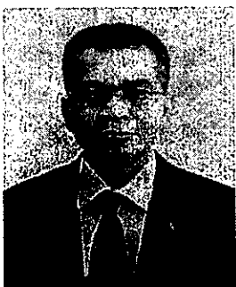
๓. นายรักษเกชา แฉ่ฉาย อดีตเลขาธิการสำนักงานผู้ตรวจการแผ่นดิน