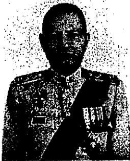
๑. พลตำรวจเอก รอย อิงคไพโรจน์ เลขาธิการสภาความมั่นคงแห่งชาติ

หากท่านใดมีข้อมูล ข้อเท็จจริง และข้อคิดเห็นเกี่ยวกับผู้สมัครเข้ารับการสรรหา เป็นบุคคลผู้สมควรได้รับการแต่งตั้งเป็นผู้ตรวจการแผ่นดิน