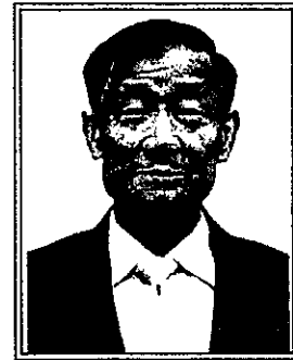
พลเรือเอก ประสาน สุขเกษตร (ด้านการส่งเสริมสิทธิและเสรีภาพของประชาชน)