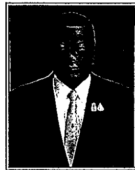
พลโท มณฑล ปราการสมุทร (ด้านกิจการโทรทัศน์)