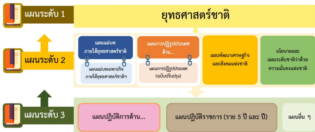
รูปที่ 1 ระดับของแผน ตามมติคณะรัฐมนตรี เมื่อวันที่ 4 ธันวาคม พ.ศ. 2560