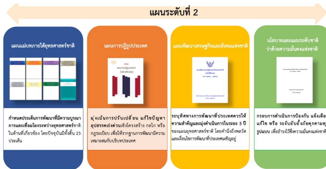
รูปที่ 2 องค์ประกอบของแผนระดับที่ 2